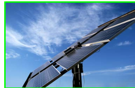
Energię słoneczną można wykorzystywać m.in. do ogrzewania budynków