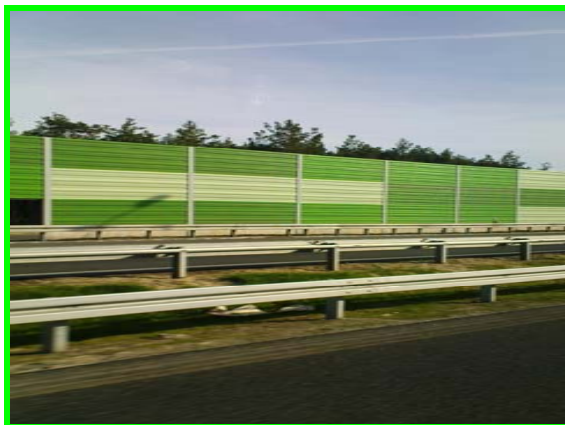
Ekran akustyczny ograniczają emisję fal dźwiękowych poza obszar drogi.