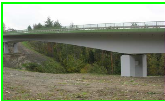
Przejście dla zwierząt przywraca łączność w korytarzu ekologicznym. (Fot. R. Mysłajek, wiadukt na S 69)

Badanie ankietowe zostanie przeprowadzone wśród beneficjentów Programu dwa razy w ciągu procesu realizacji projektu, tj. po podpisaniu umowy o dofinansowanie oraz po zakończeniu projektu. Najpierw zostanie zbadana Państwa gotowość do stosowania w projektach pro-środowiskowych rozwiązań, a następnie faktycznie uzyskane efekty.