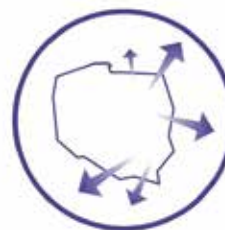
Kompleksowa pomoc MŚP we wchodzeniu na nowe rynki