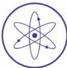
Wsparcie MŚP we wdrażaniu innowacji