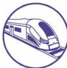
Zwiększenie dostępności makroregionu w zakresie infrastruktury transportowej