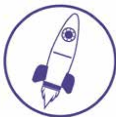
Tworzenie warunków sprzyjających powstawaniu innowacyjnych MŚP