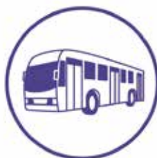
Poprawa efektywności układów transportowych oraz zrównoważonego transportu miast wojewódzkich i ich obszarów funkcjonalnych